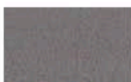
31CE0283 Grabado/Engraving: Búfalo Viver/ Viver 8028