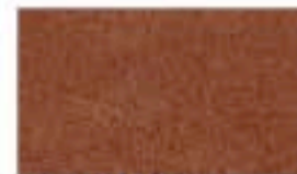
31CE0323 Grabado/Engraving: Oxen Cafe Tamm/ Tamm Brown 2015