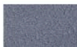
31CE0286 Grabado/Engraving: Búfalo Gris/ Grey 8040