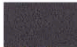
31CE0123 Grabado/Engraving: Glace Alemán Café Oscuro/ Dark Brown 2003