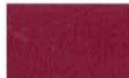
31CE0355 Grabado/Engraving: Oxen Vino/ Red wine 5067