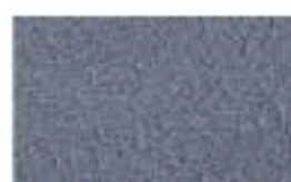
31CE0286 Grabado/Engraving: Búfalo Gris/ Grey 8040