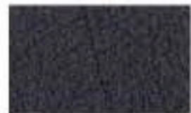
31CE0290 Grabado/Engraving: Búfalo Negro/ Black 900