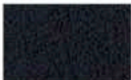
31CE0291 Grabado/Engraving: Búfalo Negro/ Black 900