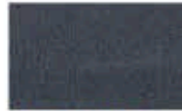
31CE0189 Grabado/Engraving: Glace Alemán Gris/ Grey 8042