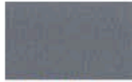
31CE0185 Grabado/Engraving: Glace Alemán Gris/ Grey 8047