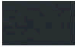
31CE0390 Grabado/Engraving: Oxen Negro/ Black 900