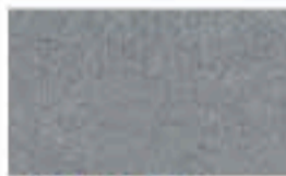
31CE0387 Grabado/Engraving: Oxen Gris/ Grey 873