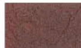
31CE0325 Grabado/Engraving: Oxen Cafe/ Brown 2042