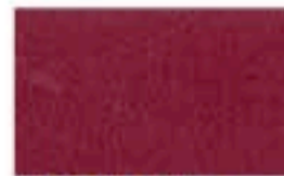
31CE0355 Grabado/Engraving: Oxen Vino/ Red wine 5067