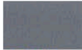
31CE0185 Grabado/Engraving: Glace Alemán Gris/ Grey 8047