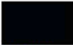
31CE0190 Grabado/Engraving: Glace Alemán Negro/ Black 900