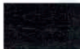
31CE1190 Grabado/Engraving: Balu Negro/ Black 900