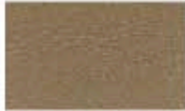
31CE0125 Grabado/Engraving: Glace Alemán Café/ Brown 2047