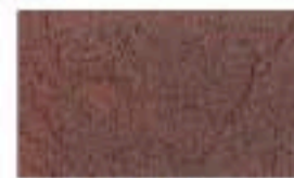
31CE0325 Grabado/Engraving: Oxen Cafe/ Brown 2042