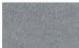
31CE0387 Grabado/Engraving: Oxen Gris/ Grey 873