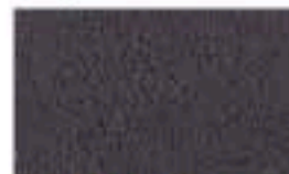
31CE0123 Grabado/Engraving: Glace Alemán Café Oscuro/ Dark Brown 2003