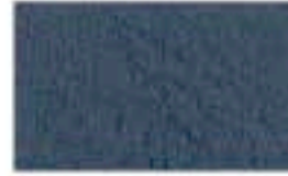
31CE0365 Grabado/Engraving: Oxen Azul/ Blue 6146