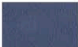
31CE0160 Grabado/Engraving: Glace Alemán Azul/ Blue 6151