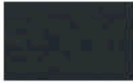
31CE0390 Grabado/Engraving: Oxen Negro/ Black 900