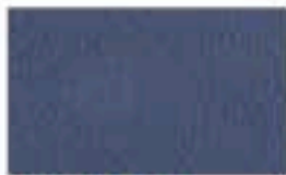
31CE0160 Grabado/Engraving: Glace Alemán Azul/ Blue 6151