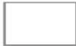
31CE0301 Grabado/Engraving: Oxen Blanco/ White 05